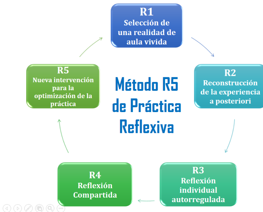
Figura 1. Método R5 de Práctica Reflexiva.