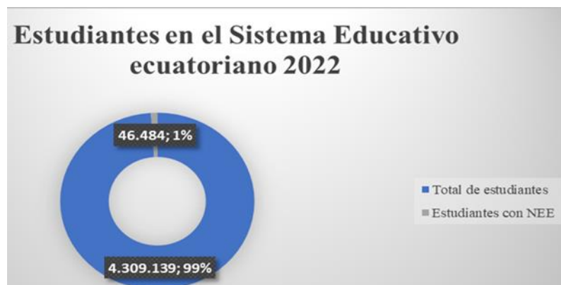
Gráfica 1. Estudiante en el sistema educativo.