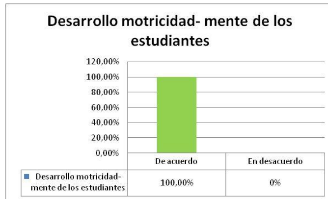
Figura 3. Desarrollo motricidad- mente de los estudiantes.