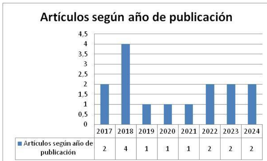
Figura 2. Artículos según año de publicación. Elaboración: El autor.

La figura 1, muestra los buscadores utilizados y el número de artículos que se eligieron. Los buscadores con más artículos escogidos fueron de Scielo con un total de 9 (60%), le sigue Redalyc con 6 representando el (40%). Ahora bien, respecto a sus años de publicación, se tiene lo siguiente: