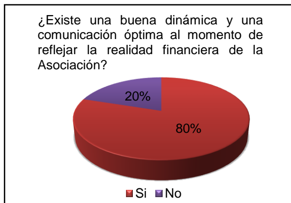
Figura 2. Principales resultados del diagnóstico. Fuente: Encuesta.