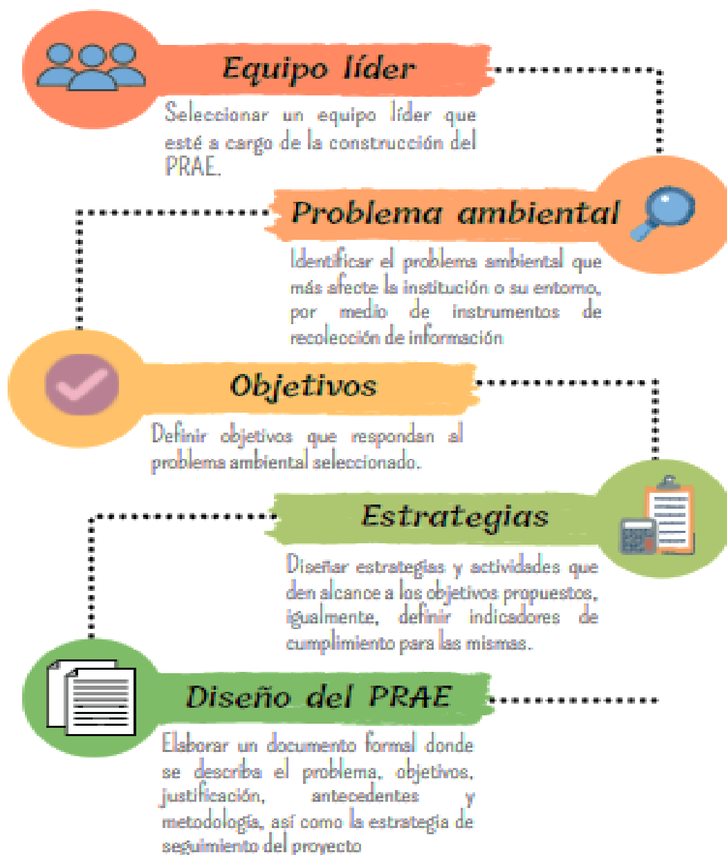
Figura 3. Ruta estructurada para la reconstrucción del PRAE. Elaboración: Los autores.